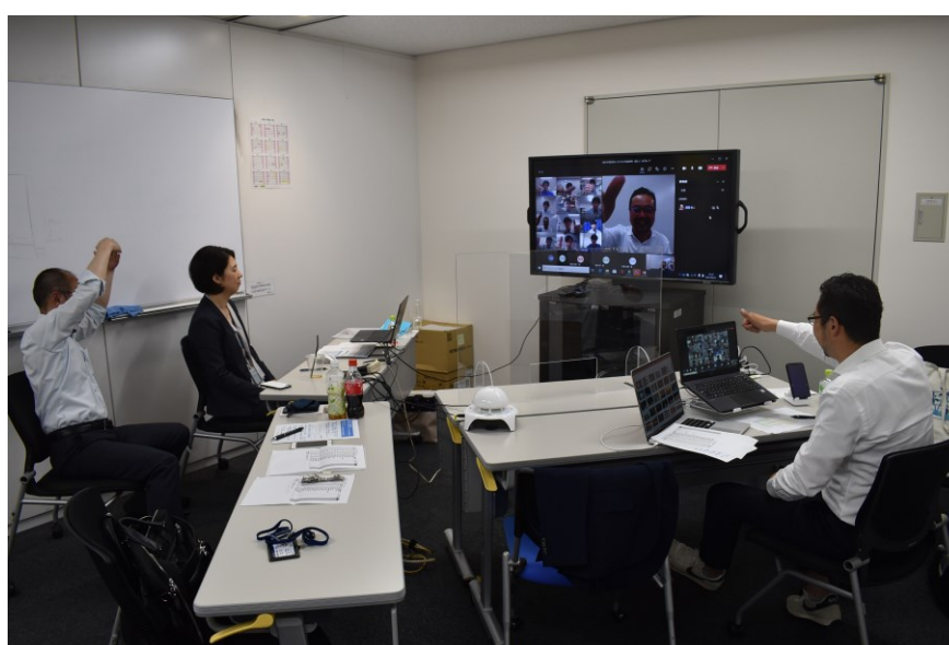
研修中の様子（本社内）